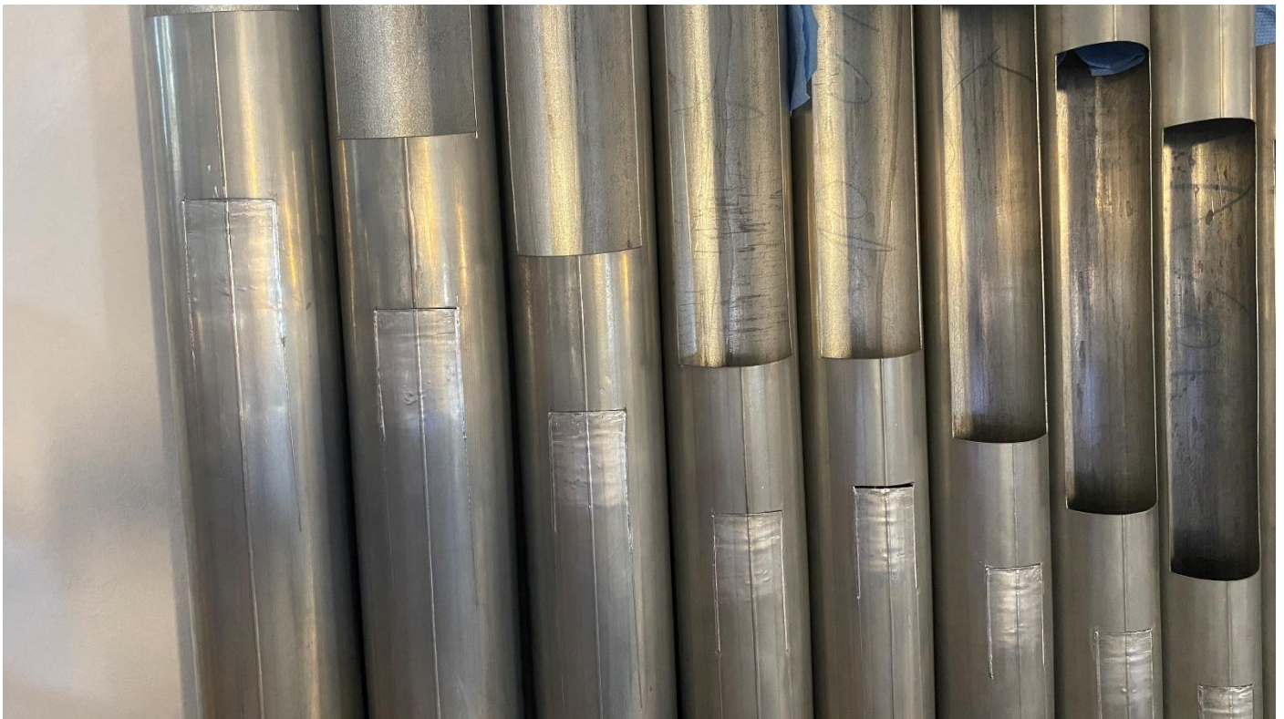
Prospektpipeifen nach der Restaurierung