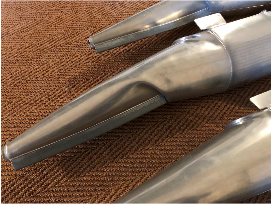
stark deformierte Prospektpipeifen – Principalbass 16' G#